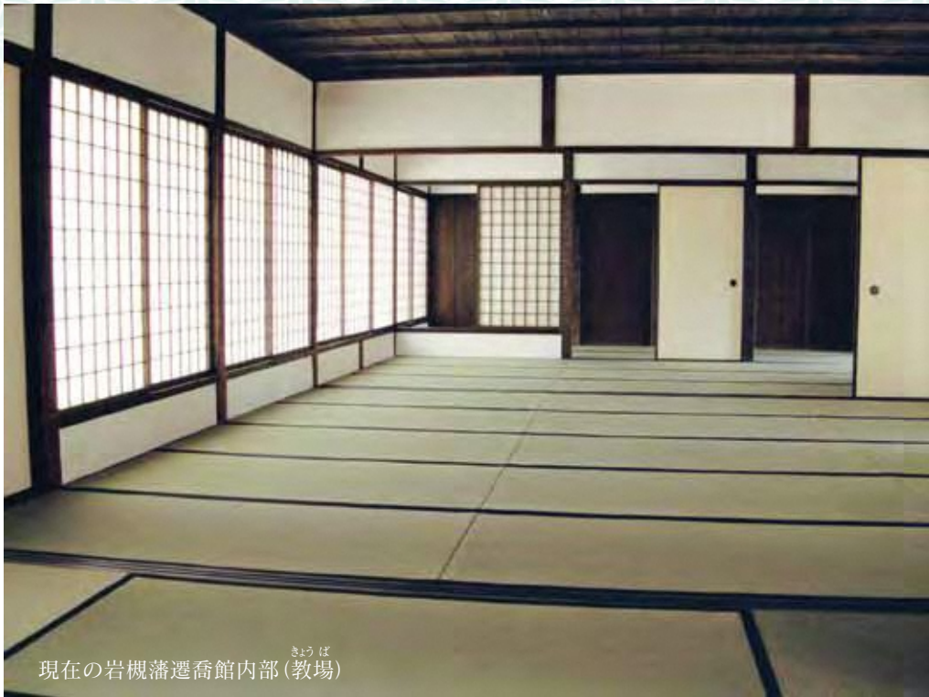
現在の岩槻藩遷喬館内部(教場)