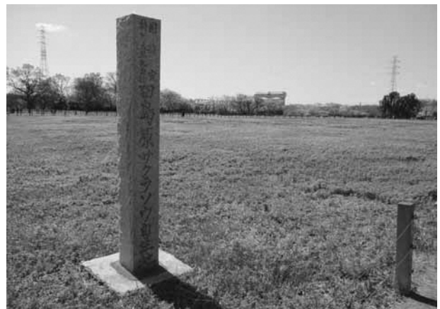
▲田島ヶ原サクラソウ自生地

近年、サクラソウの株数が減少傾向にあるため、その要因を探るべく、本年度から緊急調査を実施し、今後の保全につなげていきます。