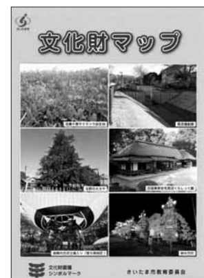
▲文化財マップ表紙