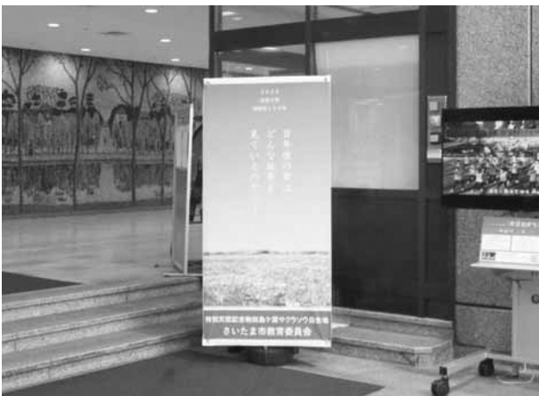
▲市役所玄関に設置したバナー

田島ヶ原サクラソウ自生地国指定100年を周知するため、広報用グッズを作成。青空のもとピンク色のサクラソウが咲き誇るイメージポスターを様々な形態で展開しました。市ホームページからプリントアウトすることで、自宅で手作りするすることができるアイテムは、部屋に飾っていただくことを想定しました。またシールにできるタイプのデザインも用意し、幅広い年齢層の方々に田島ヶ原サクラソウ自生地と指定100年の歴史を知っていただきたいという思いを込めました。