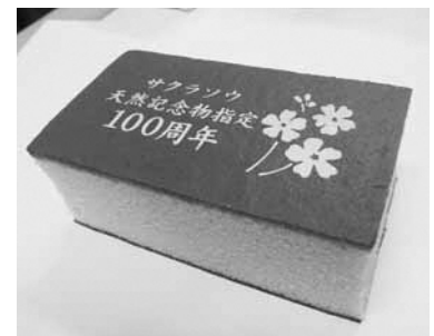
▲サクラソウカステラ