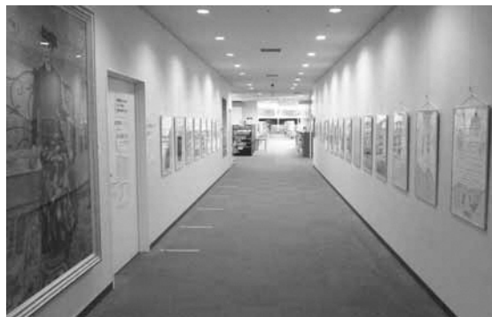
▲中央図書館での展示の様子