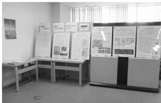
▲桜図書館での展示の様子