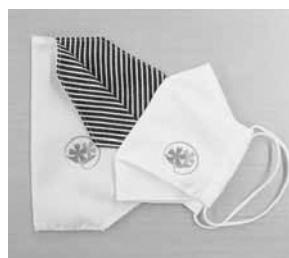
▲サクラソウマスク