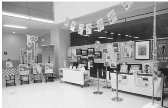
▲桜区役所での展示の様子