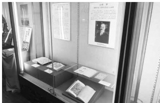
▲浦和博物館での展示の様子