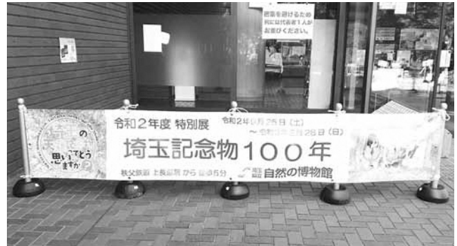
▲展示期間中の博物館玄関の様子