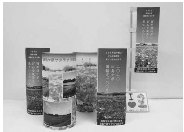
▲手作りでできる各種グッズ