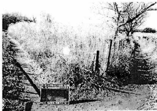
田島ヶ原サクラソウ自生地