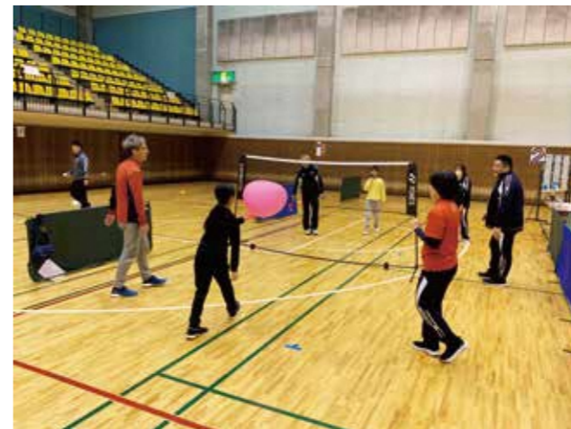
子どものスポーツ能力測定会、大人の体力測定会(付帯イベント)