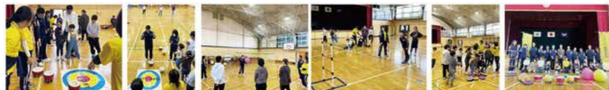
フロアカーリング ふらば～るバレー ラダーゲッター ドッチビー

大谷場小学校の体育館にて「楽しいスポーツを見つけよう♪」を開催いたしました。まず最初はフロアカーリング。次に、大人はふらば～るバレー、子供たちはラダーゲッターに分かれてトライしました。最後は全員でドッチビーです。この日一番の歓声が体育館に上がりました。「おもしろそうだったので参加しました～。楽しかったです～！！」というお声をたくさんいただきました。