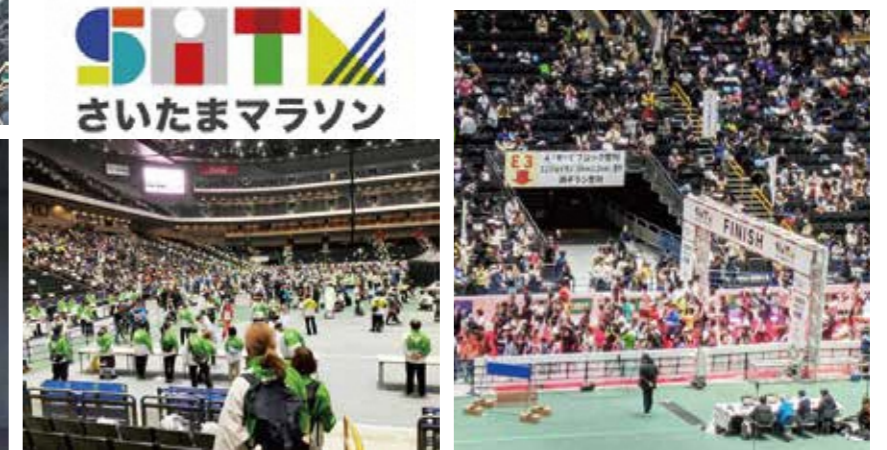
さいたまマラソン(競技運営)