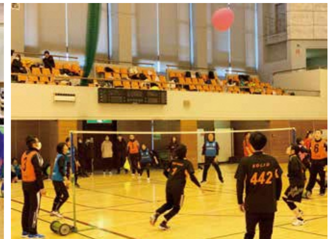
第8回ふらば～るバレー親善大会