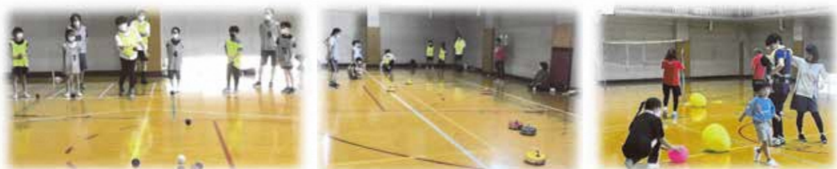
ポッチャは簡単なようで奥が深い！ フロアカーリングは難しい！ 楽しいふらば～るバレー！

これからもポスター等で周知しながら、体験会を開催しますので、皆様奮ってご参加ください。