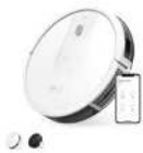
Eufy RoboVac 15C カラー：ホワイト、ブラック

https://www.ankerjapan.com/pages/robovac-support