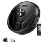
Eufy RoboVac X8 Hybrid カラー：ブラック、ホワイト