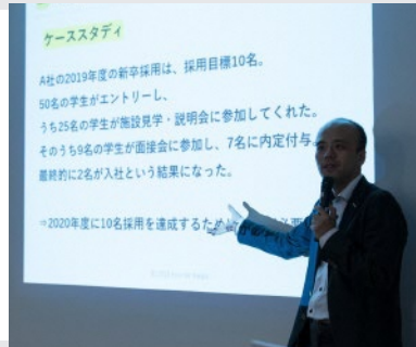
※昨年のプログラム時の様子です。今年はオンライン開催になります。