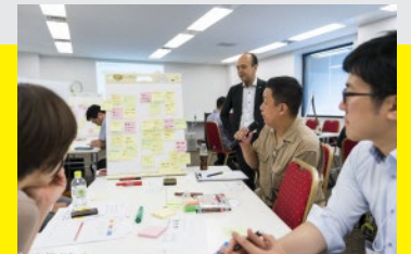
※昨年のプログラム時の様子です。今年はオンライン開催になります。