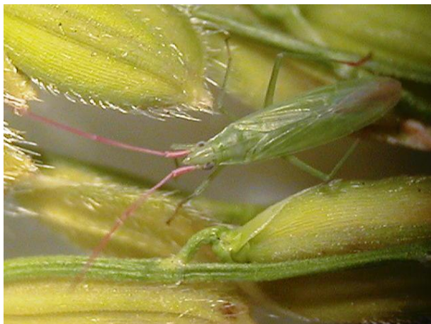
写真3 イネホソミドリカスミカメ成虫(体長約 6mm)