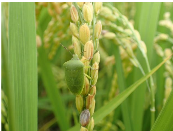
写真2 ミナミアオカメムシ成虫(体長約14mm)