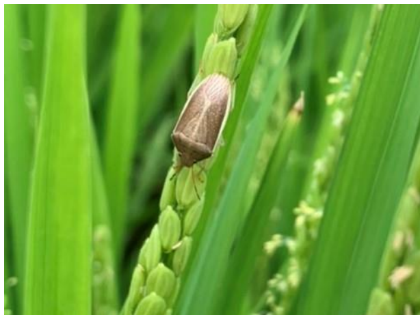
写真1 イネカメムシ成虫(体長約12mm)