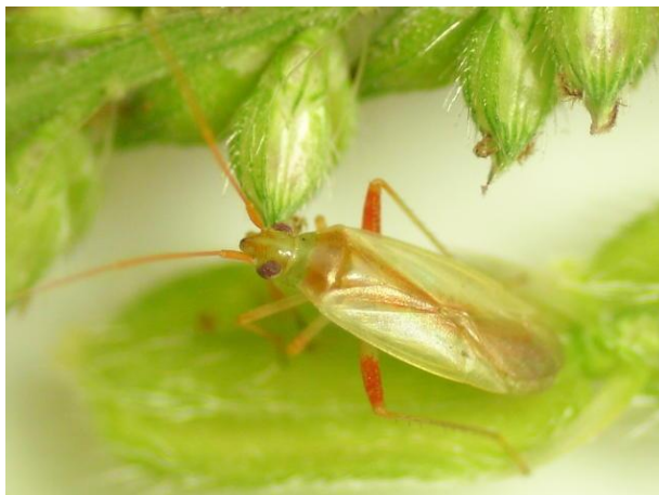
写真4 アカスジカスミカメ成虫(体長約 5mm)