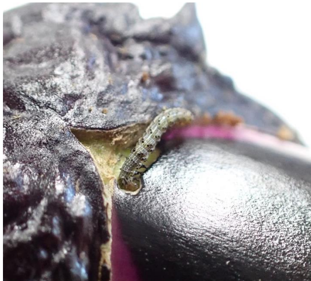
写真1 ナス果実に食入するオオタバコガ若齢幼虫