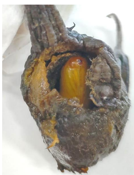
写真2 食害したナス果実内で蛹化したオオタバコガ