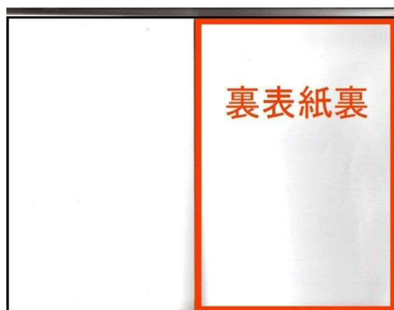
② 裏表紙裏 赤枠内が広告