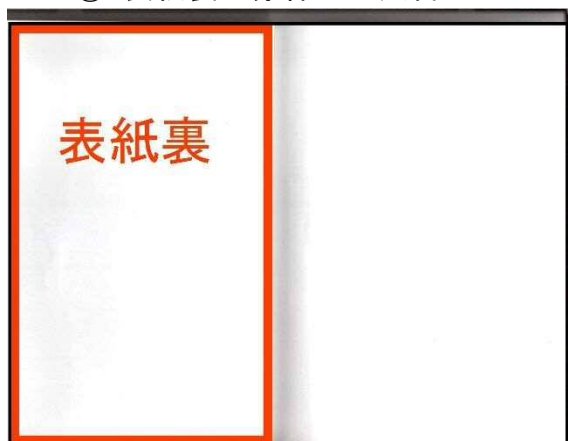
① 表紙裏 赤枠内が広告