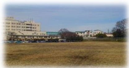
現在の埼玉県の公有