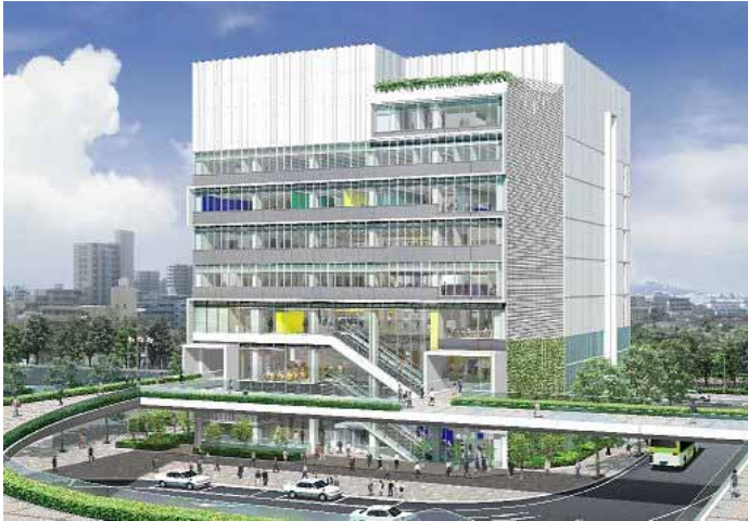
・全体外観のイメージ図