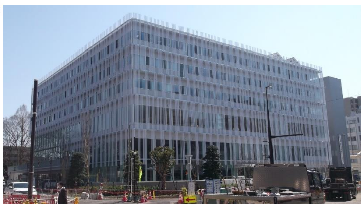
(平成31年3月20日 氷川緑道西通線側より撮影)