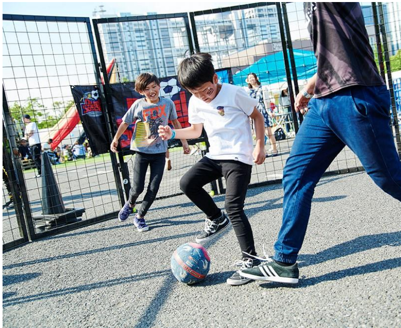
【デュエルサッカー】