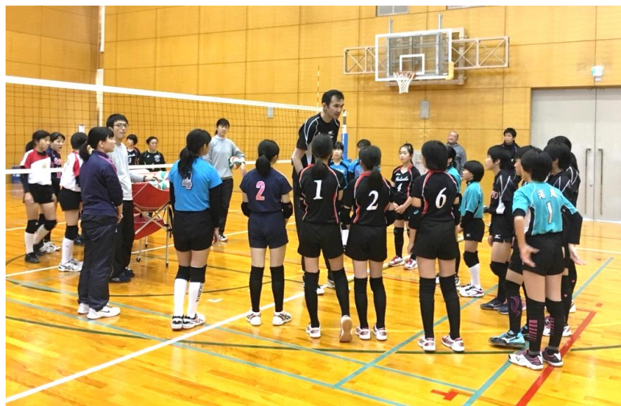
【大竹秀之（オリンピック）のバレーボール教室】