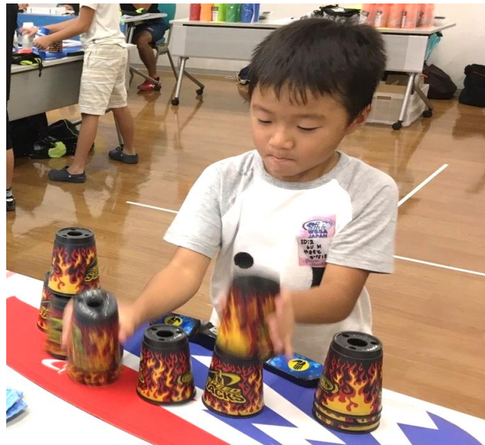
【スポーツスタッキング】