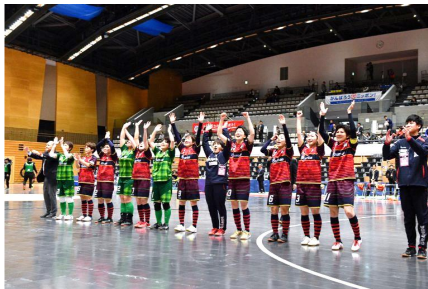
【さいたまSAICOLOのフットサル教室】