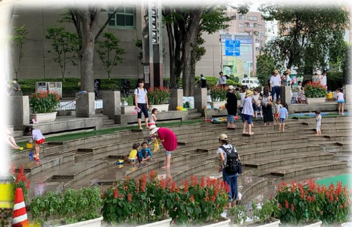
水の流れる段床 (流水は夏期のみ)