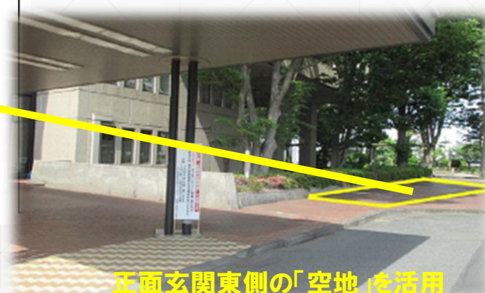
正面玄関東側の「空地」を活用