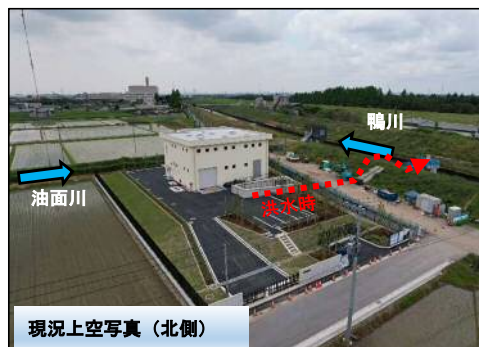
現況上空写真（北側）