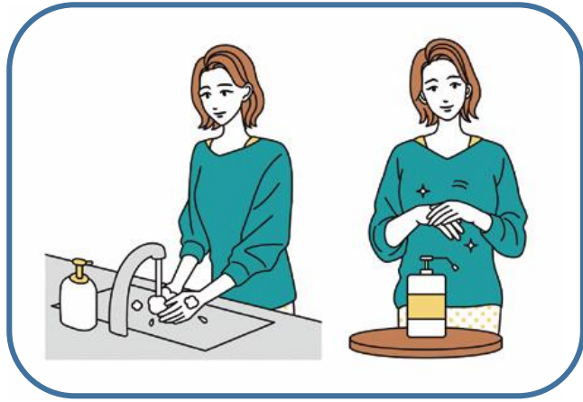
手洗い・手指消毒