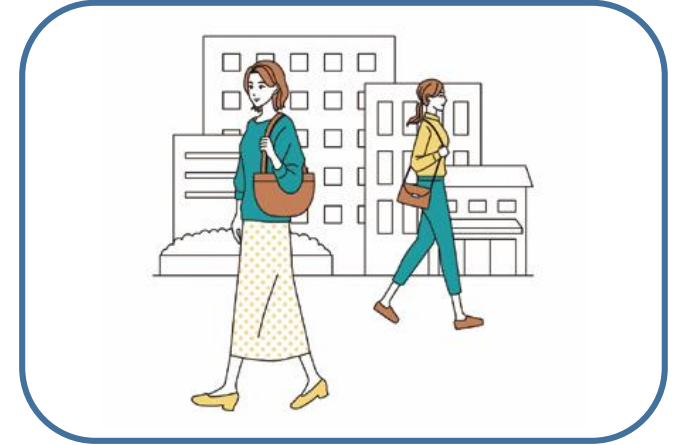
人と人との距離の確保