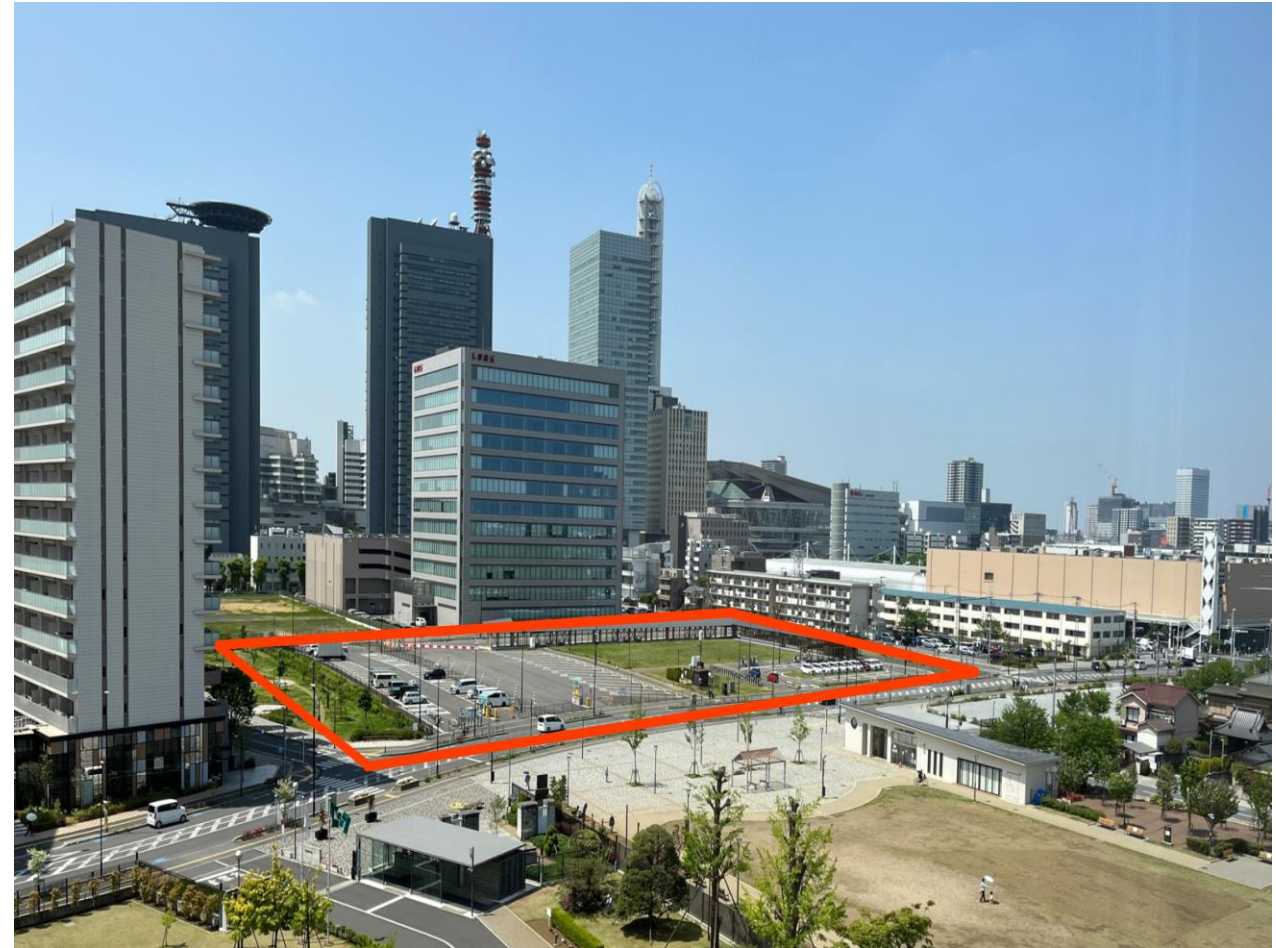
移転地(さいたま新都心バスターミナルほか街区)