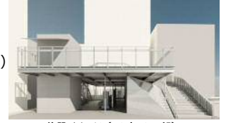
施設イメージ（エントランス部）

導入機能 トイレ（男、女、みんなのトイレ） コミュニティサイクルポート 屋上テラス（150㎡） 無線公衆LAN環境（Wi-Fi）