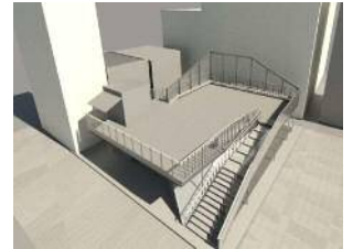
施設イメージ（屋上広場）