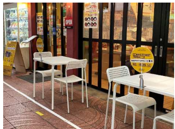
▶おおみやストリートテラス@一番街