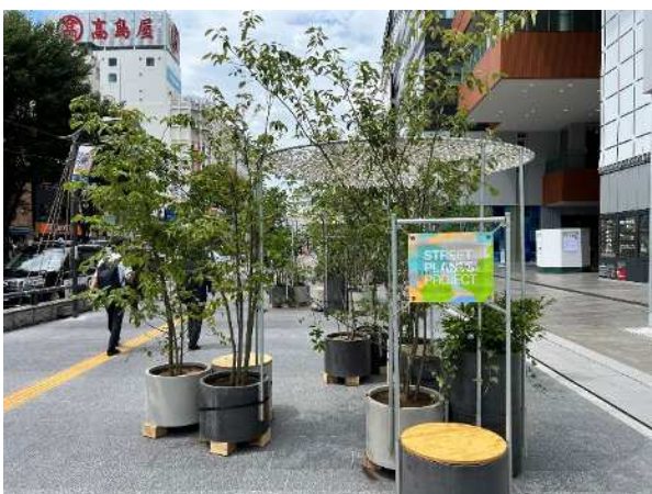
▶ストリートプランツ