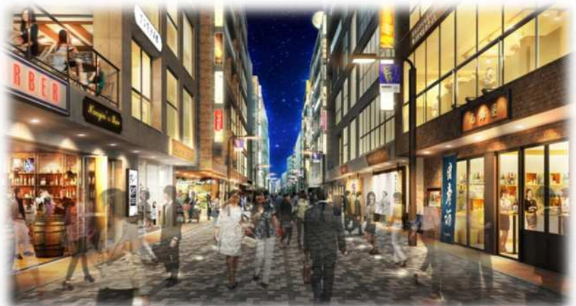
▶南銀座通り 無電柱化、舗装美装化、道路拡幅（地区計画）