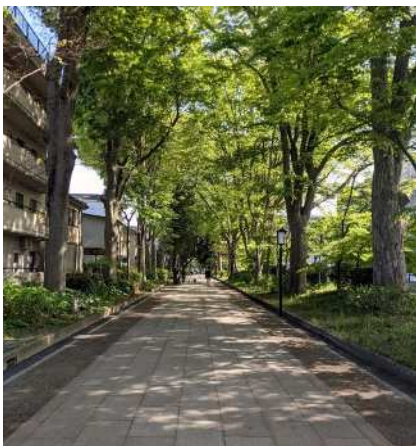
▶氷川参道 氷川緑道西通り線の交互通行化に合わせた歩行者専用化