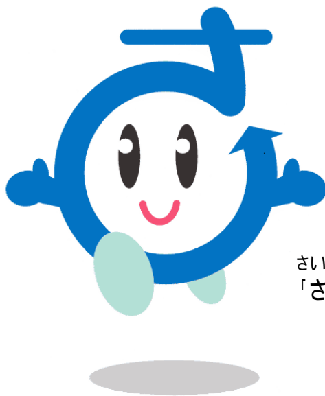
さいたま市環境キャラクター 「さいちゃん」