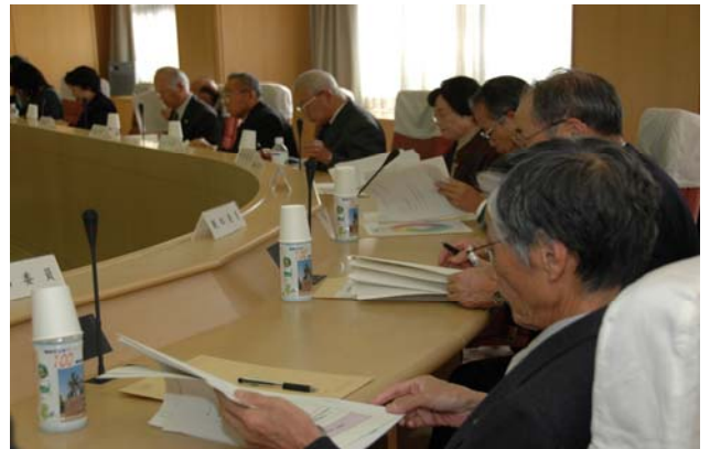
【第1回庁舎整備検討委員会の様子】 テーマ：さいたま市のあゆみと市庁舎の検討経緯