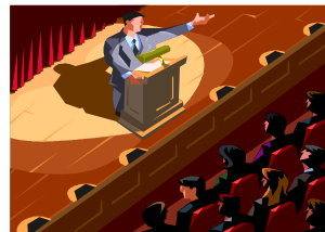
【検証大会開催のイメージ】

・平成17年度に策定した「理想都市実現に向けた行動計画-マニフェスト工程表-」の実績評価の方法は、都市経営戦略会議(注1)における内部評価としており、検証大会は実施していません。