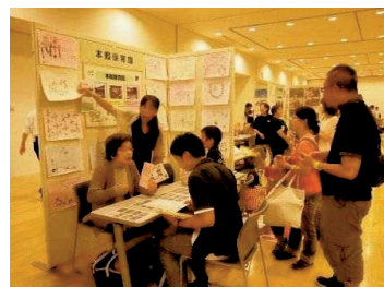
保育施設紹介コーナー

子育て支援施設の整備等子育て環境の充実が図られる一方、子育て支援情報の発信がさらに重要視されており、保育施設をはじめ、子育てを支援する側と保護者側との情報のマッチングや保護者同士のコミュニケーションの場を提供する必要があります。