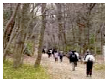
北区ウォーキングイベント(鎌倉街道)

生活習慣病や介護予防、ストレスの低減等の健康増進を目的としたウォーキングなど、誰でも手軽に健康づくりに取り組める機会が必要です。そのため、北区の名所等も楽しめる「北区ウォーキングガイド」を活用し、ウォーキングを始めるきっかけやウォーキングを継続するための機会を提供する必要があります。