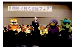
子育て支援フェア

子育ての不安などを軽減するためには、区内にある子育て支援機関が連携を深め、子育て中の親子の交流の場を提供し、育児相談や子育て支援情報の提供など、地域に根ざした子育て支援体制を強化することが必要です。