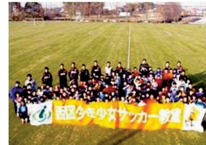
西区少年少女サッカー教室

西区は自然環境に恵まれていることに加え、三橋総合公園や大宮花の丘農林公苑など、特色ある公園が多く存在しています。これらの自然を生かすとともに、古くから伝わる伝統芸能の継承、区内にクラブハウス・練習場がある大宮アルディージャなど、地域資源を活用したまちづくりに取り組む必要があります。