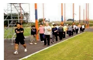
ウォーキング講習会

高齢者が、心身ともに健康を維持し、生きがいを持って地域活動に参加することは地域の活力にもつながることから、健康寿命の延伸や介護予防などの支援が必要です。