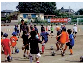
北区少年・少女サッカー教室

スポーツは、体力の向上、ストレスの発散など、心身両面にわたる健康の増進、子どもたちの健全育成や交流の促進を図るうえで大変重要なものです。さいたま市を本拠地とする大宮アルディージャや女子プロ野球チームとの連携により、スポーツを活用したまちづくりを効果的に推進する必要があります。