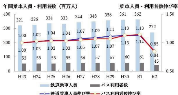
【市内の鉄道・バスの年間利用者数の推移】

また、まちづくりと連携した駅周辺の交通結節機能の強化や、過密を回避し、安心して利用できる環境づくりを総合的に展開していくことが重要です。