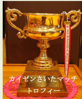
カイゼンさいたまッチ トロフィー

皆様の改善事例は、各局の業務改善委員会、事前審査委員会による選考を行い、6つの優秀事例に絞り込みます。選ばれた6事例は、改善事例発表会「カイゼンさいたまッチ」において発表していただきます。