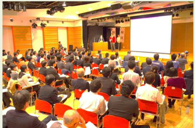
昨年度のカイゼンさいたまッチの様子