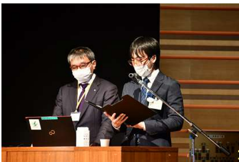
発表課によるプレゼンテーション