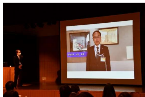
局長メッセージ動画の上映