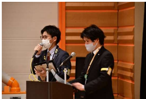
掛け合いながらの楽しい司会進行