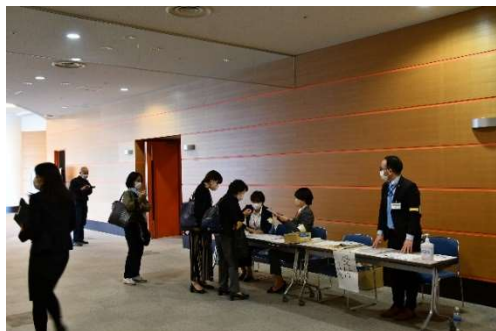
観覧のみなさんをお出迎え

当日の運営は庁内公募により結成されたカイゼンサポーター11名が中心となり、司会、舞台演出など多岐にわたる運営を行いました。