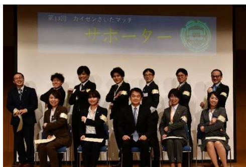
市長とカイゼンサポーター職員で記念撮影