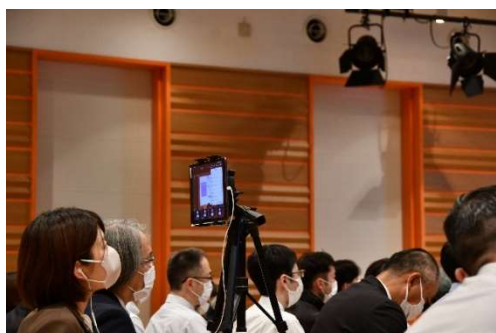
執務室にいる各発表課の職員に向けてリアルタイム配信