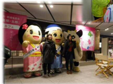
移住カフェの様子