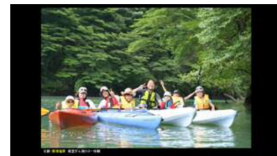
■ 連携PR事業（駅サイネージ放映）で使用した写真の一部