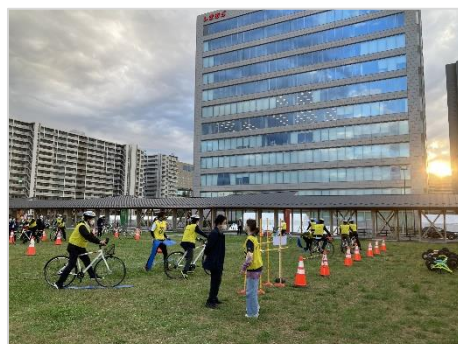
現地視察 （デンマーク式自転車教室）