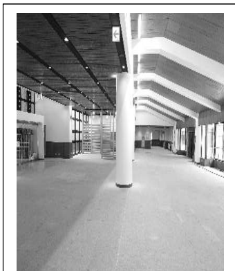
エントランスと ロビーの照明