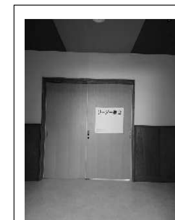
2階リーダー室の扉