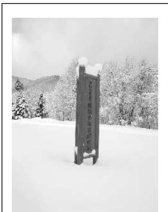
新しい表示板（バス駐）