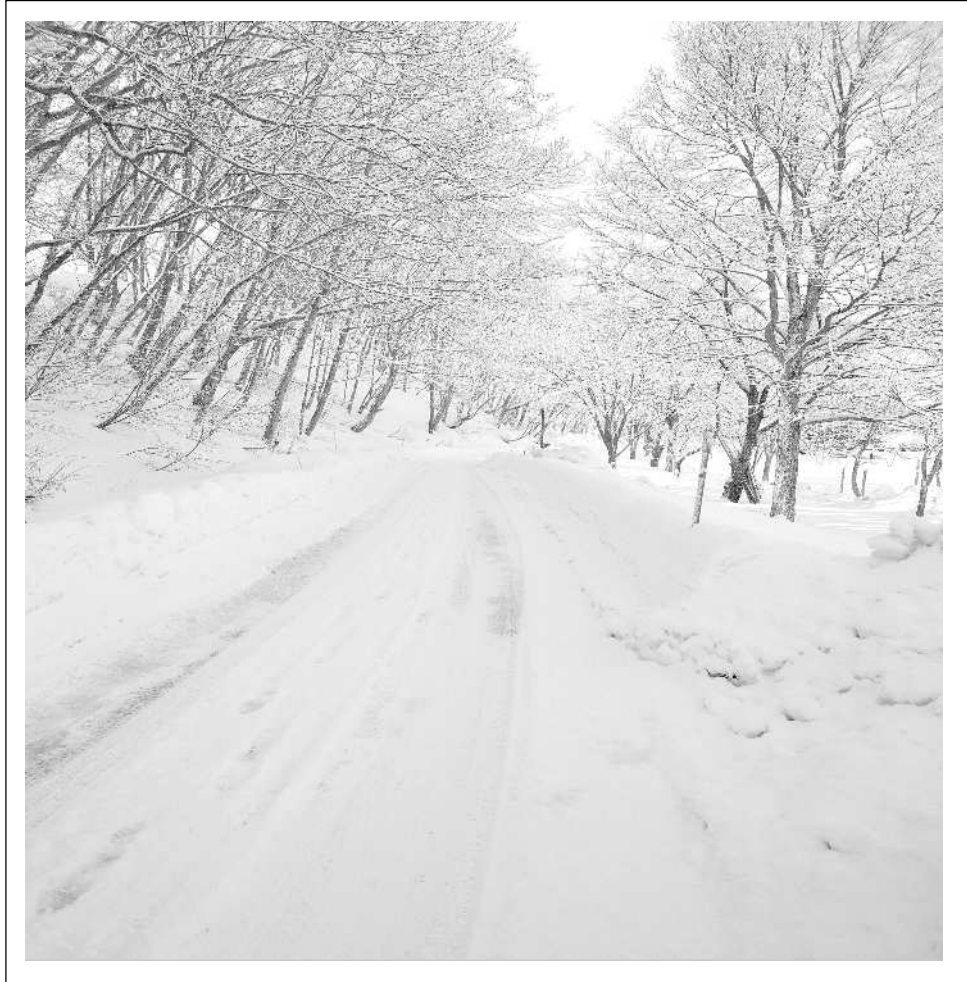
3月15日朝の景色（バス駐車場から自然の家に向かう幹線道路）