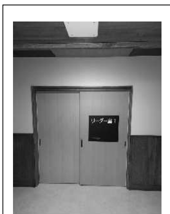
1階リーダー室の扉