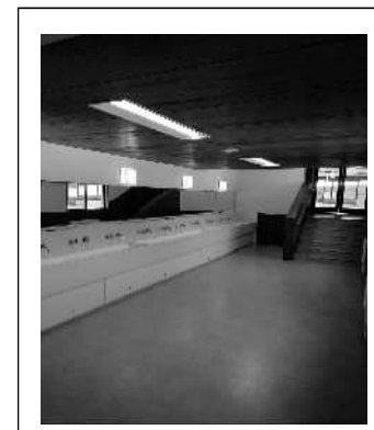
食堂前の手洗い場