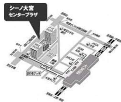
大宮駅西口徒歩8分