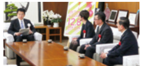
表彰式の後、清水市長を交えて歓談しました。