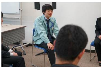
先輩とのフリー座談（土木）