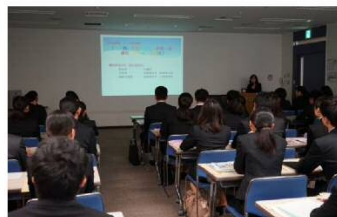
市の施策・事業（福祉）