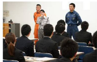
先輩職員のトークセッション（消防）