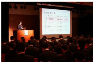
採用試験の概要（多目的ホール）