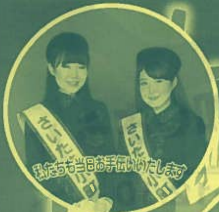
「さいたま観光大使」 第9代 さいたま小町