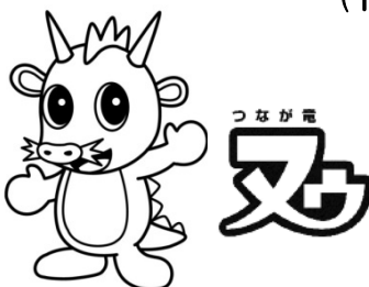
さいたま市PRキャラクター