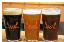
県内クラフトビール各種

氷川ブリュワリー（さいたま市大宮区）、甘味屋田むら（さいたま市大宮区）、舟和本店浦和工場（さいたま市桜区）、豆腐ラーメン（さいたま市岩槻区）、川口ブルワリー（埼玉県川口市）、そうからあげ（埼玉県草加市）、所沢ビール（埼玉県所沢市）、彩の国地鶏タマシャモ普及協議会（埼玉県坂戸市）、ぎょうざの満州（埼玉県坂戸市）、みそだれやきとり（埼玉県東松山市）、嵐山辛モツ焼そば（埼玉県嵐山町）、越生ブリュワリー（埼玉県越生町）、こぶし花ビール（埼玉県羽生市）、わらじかつ（埼玉県秩父市）、東北復興支援ブース、さいたま市ピアショップ、埼玉マラソングランドスラムブース、文化放送PRブース、FM NACK5放送ブース、大会公式グッズ販売 ほか