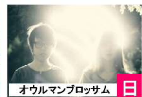
オウルマンブロッサム