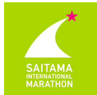
さいたま国際マラソン大会ロゴ