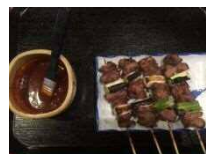
みそだれやきとり 三金