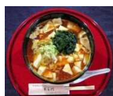
豆腐ラーメン さいたま豆腐ラーメンの会