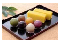
芋ようかん・あんこ玉 （株）舟和本店浦和工場