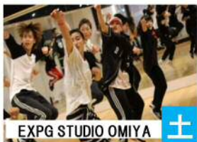
EXPG STUDIO OMIYA

初心者からアスリートまで、50年以上の歴史と実 績を誇る世界最大級のジム、ゴールドジムによる ランナー向けワークショップ