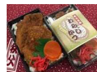
わらじかつ みやのかわ商店街振興組合