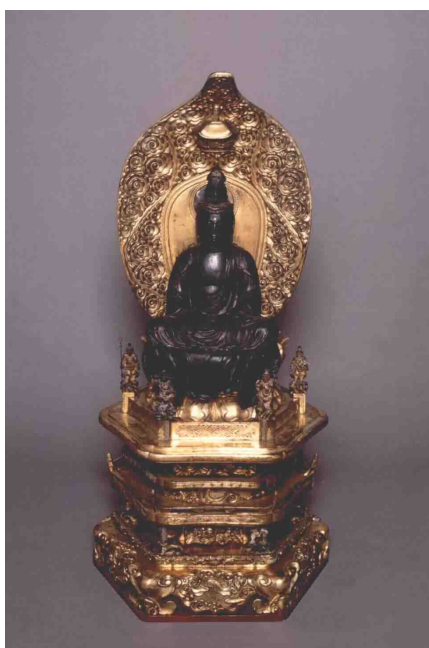
▲大圓寺木造聖観音菩薩坐像