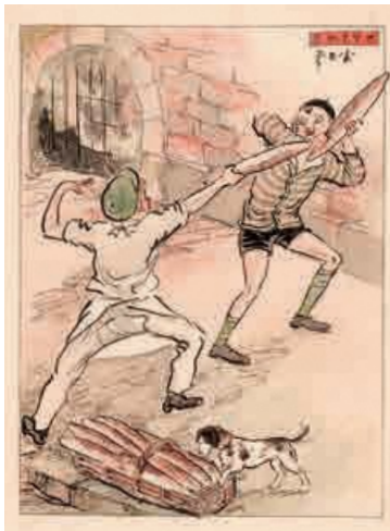
「巴里見物3 パン屋の小僧」