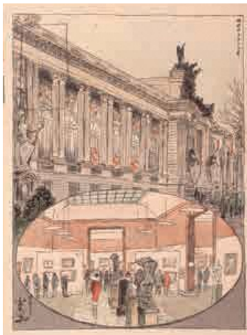
「サロンドオトンヌ」