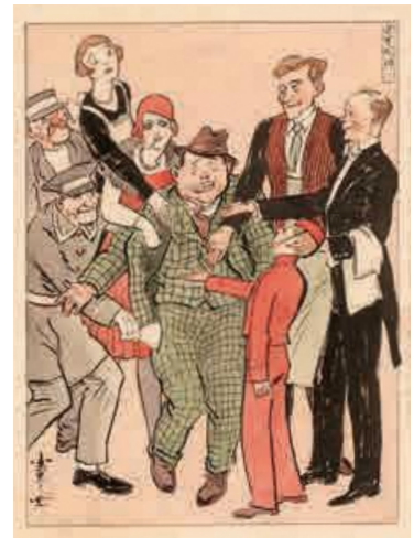
「巴里風俗(八) チップ、チップ、チップ」