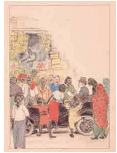
「シンガポール見物 其二」