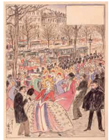
「巴里風俗(十七)」 (サンカトリーヌのお祭り)