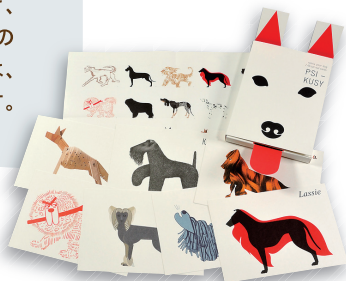
ガング・デザイン/パコ・ユレック 《いたずら 雑種犬をつくらう》 出版社賞