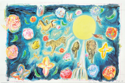
荒井良二《きょうはそらにまるいつき》

■日本代表作家 あずみ虫、荒井真紀、荒井良二、石黒亜矢子、 きくちちぎ、こしだミカ、ズスキコージ、 tupera tupera、どいかや、中野真実、町田尚子、 皆川明、ミロコマチコ、村山純子、ヨシタケシンスケ