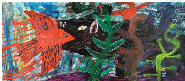
ミロコマチコ《けもののおいがしてきたぞ》金牌