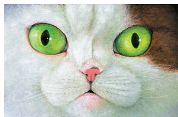
町田尚子《ネコツメのよる》