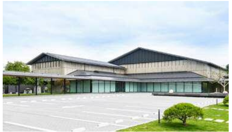
(岩槻人形博物館 外観)