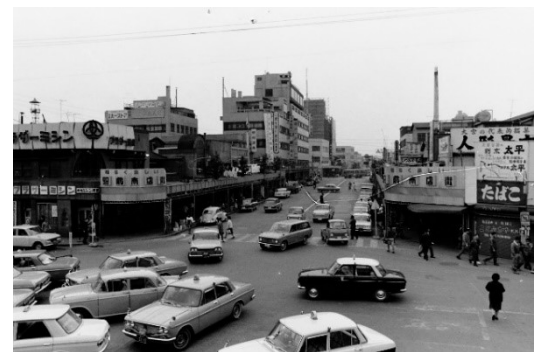
写真:1960年代の大宮駅東口の様子