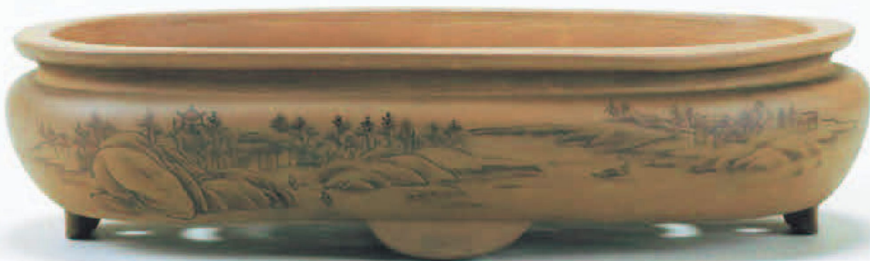
烏泥山水文楕円鉢 (大隈重信旧蔵)

— Bonsai Pot, Ukiyoe, Historical Gardening Books