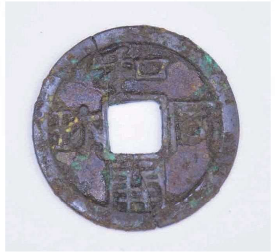
保存修理後の姿 (左のX線写真のもの)

教科書でおなじみ、あの皇朝十二銭最初の銅銭である「和同開珎」が、さいたま市で初めて、しかも2枚出土しました。そこで、同じ皇朝十二銭の一つ、平安時代の「延喜通宝」とともに展示します。保存修理後の良好な姿をあなたの目で実際にお確かめ下さい!