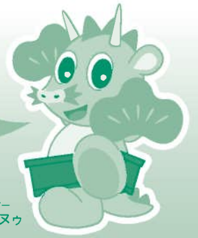
さいたま市 PRキャラクター つなが亀 ニュー