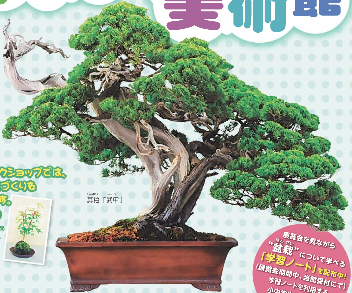
しんぱく ふこう 真柏「武甲」