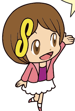
さいたま市消費生活総合センター マスコットキャラクター さいたましょうこちゃん