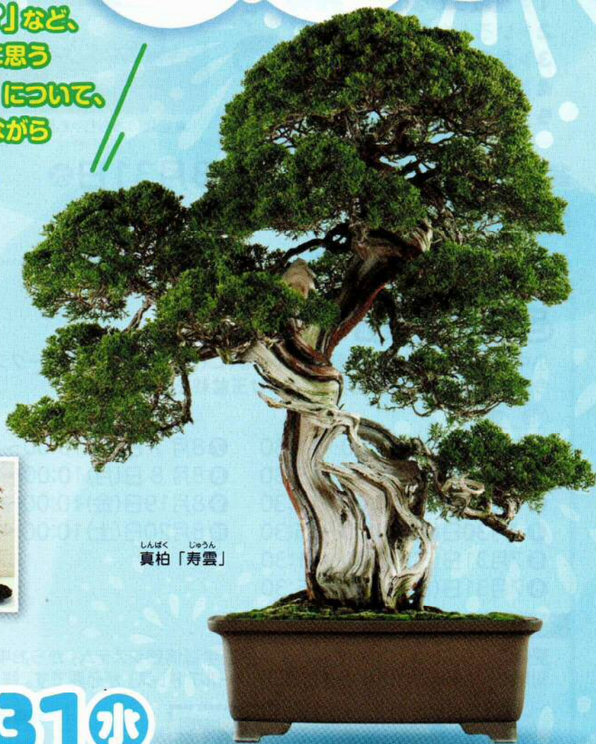
しんぱく じゅうん 真柏「寿雲」