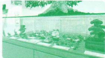
▲盆栽のおもちゃも展示します!