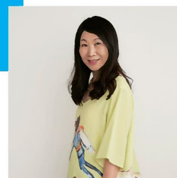
津森千里 ファッションデザイナー