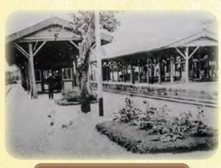
浦和駅のホーム (1909年)

休館日(各博物館共通) 月曜日(1月9日は開館)、12月28日(水)~1月4日(水)、1月10日(火)、2月14日(火)