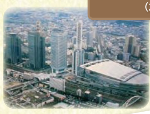
さいたま新都心ができる (2000年)