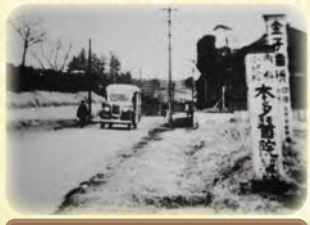
昭和の与野のまちなみ (1935年頃)