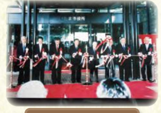
さいたま市誕生 (2001年)