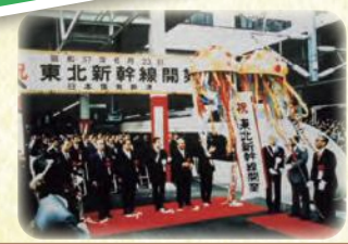
大宮駅に東北新幹線が通る (1982年)