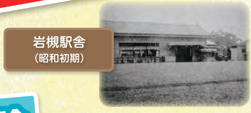
岩槻駅舎 (昭和初期)