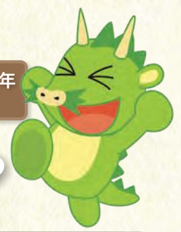
さいたま市誕生20周年 (2021年)