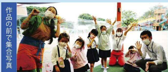
作品の前で集合写真

小学生・幼稚園児を対象としたプログラムでは、様々な「隔たり(ディスタンス)」を強いられる今の日常生活の中で、あえてディスタンスをモチーフとして描き、「隔たり」の中に豊かさを見出す作品づくりに挑戦しています。