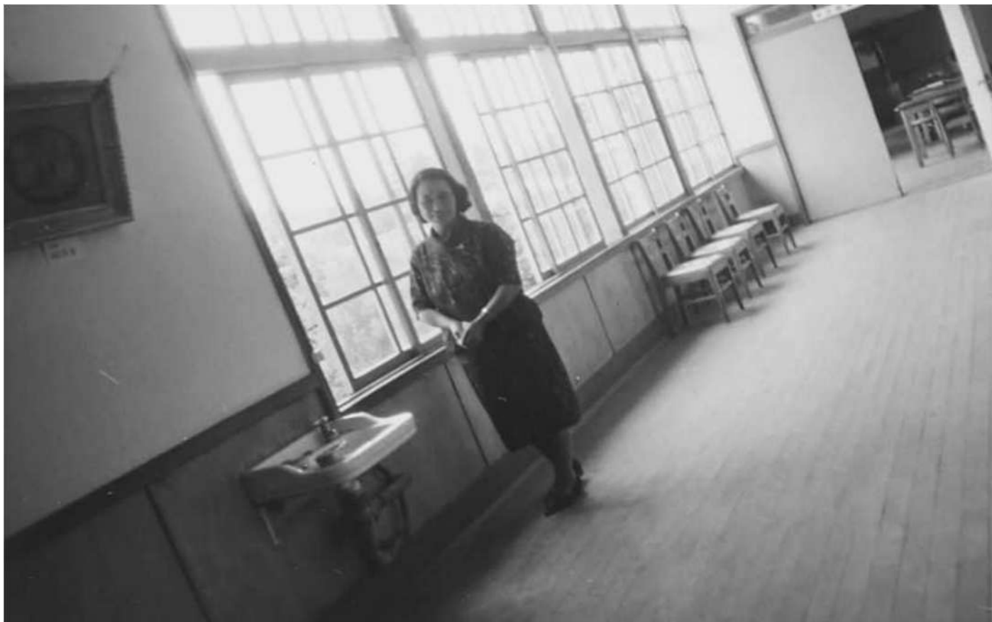
1950・60年代と思われる写真